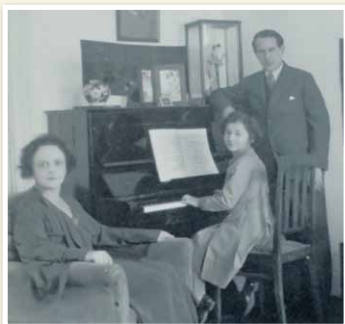
東京での家族写真