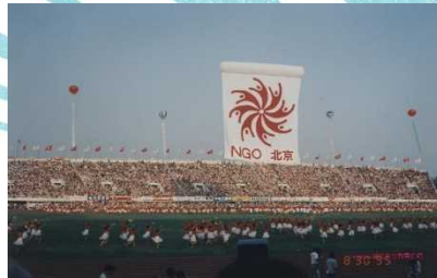
第4回世界女性会議 NGOフォーラム 開会式セレモニー