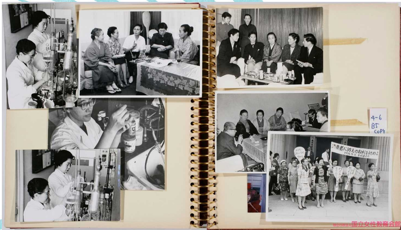
主婦連合会旧蔵アルバムより(奥むめお資料)