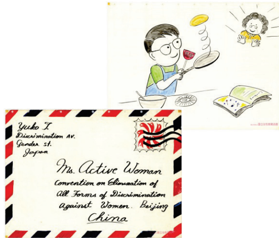
紙芝居・ゆう子さんからの手紙 北京会議NGOフォーラムにお集まりの皆さんへ