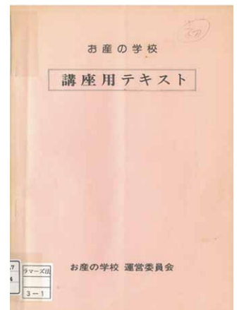
お産の学校 講座用テキスト1979年