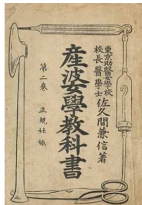
産婆學教科書 大正11(1922)年