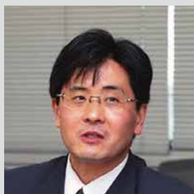
基調講演・パネリスト 文部科学省初等中等教育局課長 合田哲雄氏

1992年文部省入省。 福岡県教育庁高校教育課長、文部科学省 高等教育局大学課課長補佐、文部科学省 初等中等教育局教育課程企画室長、NSF (全米科学財団)フェロー、文部科学省 高等教育局企画官、文部科学省初等中 等教育局教育課程課、内閣官房内閣参事官 などを歴任し、現職。 著書に『学習指導要領の読み方・活かし 方』(教育開発研究所)など多数。