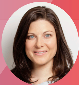
ヨハンナ・ウッカマン氏 独・社会民主党常任理事 元党青年局全国代表