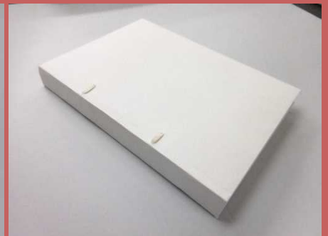
(コンサベーション・バインディング例)