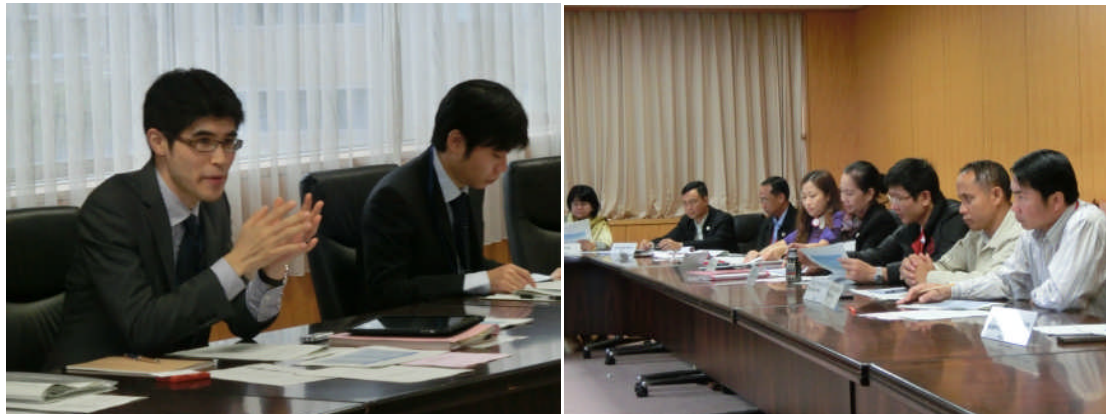
警察庁の取組について講義と意見交換