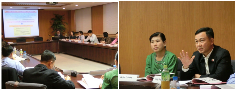
厚生労働省の取組について講義と意見交換