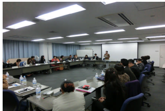
カンボジア内務省次官による謝辞