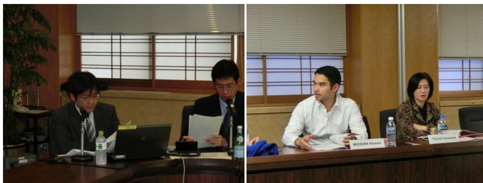
4 日目 国立女性教育会館理事長挨拶