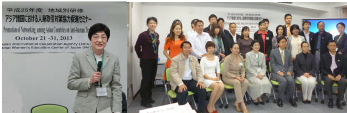
会館職員と研修員