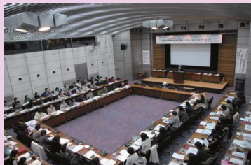
「女性のエンパワーメント国際フォーラム 2008」