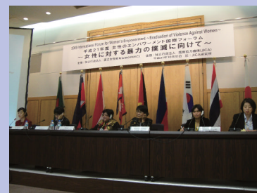
研修生による女性に対する暴力撲滅のための政策提言 於：JICA研究所