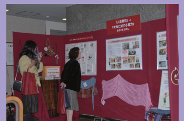
人身取引パネル展示 於：国立女性教育会館研修棟