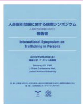
「人身取引問題に関する国際シンポジウム —人身取引の根絶に向けて—」報告書