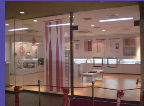
「女性アーカイフセンター」 (2008年6月開設)