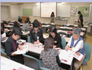
国立女性教育会館での研修風景

内閣府がおこなった調査によると10.8%の女性が配偶者から暴力を受けた経験があると答えている