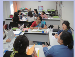
グループディスカッションを行う研修生