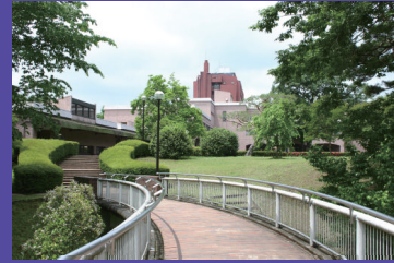
国立女性教育会館 本館棟

設立以来30年以上にわたり、NWECでは、研修・交流・調査研究・情報の各事業を実施してまいりました。