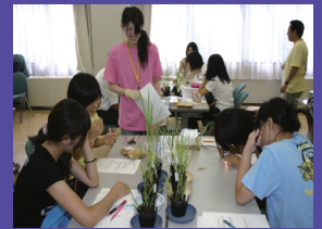
「2009年度女子中・高校生夏の学校」