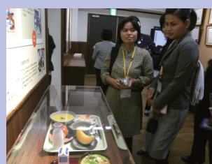
「文部科学省情報ひろば」で日本の学校給食の展示を見学する研修生